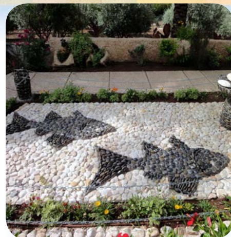
Mozaic de la Biserica de pe Muntele Fericirilor

Simbolul peștelui a fost utilizat la începutul creștinismului pentru a-l reprezenta pe Mântuitorul. El aduce aminte și de înmulțirea pâinilor și a peștilor, dar și de Sfinții Apostolii chemați să fie pescari de oameni. Numele grecesc al peștelui (IHTIS) era pentru primii creștini un acrostih hristologic: Iisus Hristos Fiul lui Dumnezeu, Mântuitorul