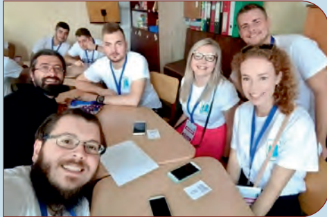
Activitate în echipă