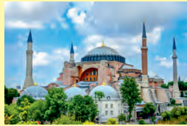
Catedrala „Sfânta Sofia”

✧ La sfârșitul secolului al X-lea solii cneazului Vladimir I al Kievului, au fost trimiși pentru a cerceta religiile lumii. Atitudinea lor la intrarea în biserica Sfânta Sofia din Constantinopol este memorabilă, aceștia fiind copleșiți de frumusețea Ortodoxiei: „Și ne-am dus la greci și ne-au condus acolo unde ei se închină la Dumnezeu lor și nu știam dacă ne găsim în cer sau pe pământ; căci pe pământ nu se găsește nicio atare priveliște, nicio atare frumusețe. Nu suntem în stare să vă povestim, dar un lucru știm, că acolo Dumnezeu locuiește în mijlocul oamenilor; și slujba lor este mai minunată decât în oricare altă țară. Nu o să uităm niciodată frumusețea aceasta”. ( Rusia: Un mileniu de istorie , de Martin Sixsmith)