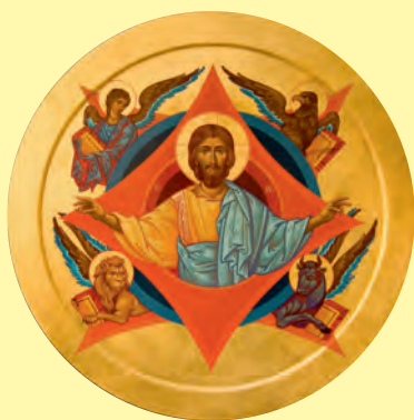
Iisus Hristos Pantocrator

Dumnezeiasca Liturghie este izvor de comuniune, de lumină și de sfințenie. Este viețuire în rai, împreună ședere cu Dumnezeu și cu sfinții Lui. (Sfântul Ioan de Kronstadt).