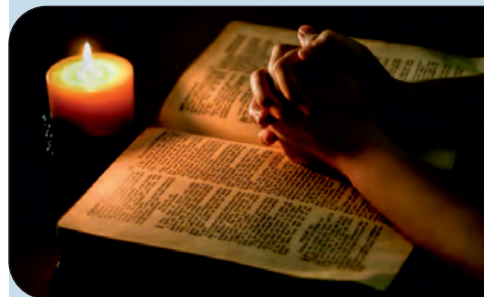
Moment de rugăciune

4. Reține următoarele citate: „Dumnezeu este iubire” (1 Ioan 4, 8), „Să vă iubiți unul pe altul” (Ioan 15, 12), „Nimic nu va putea să ne despartă de dragostea lui Dumnezeu” (Romani 8, 39). Scrie citatele pe o coală A4 și adaugă coala la glosarul cu texte biblice.